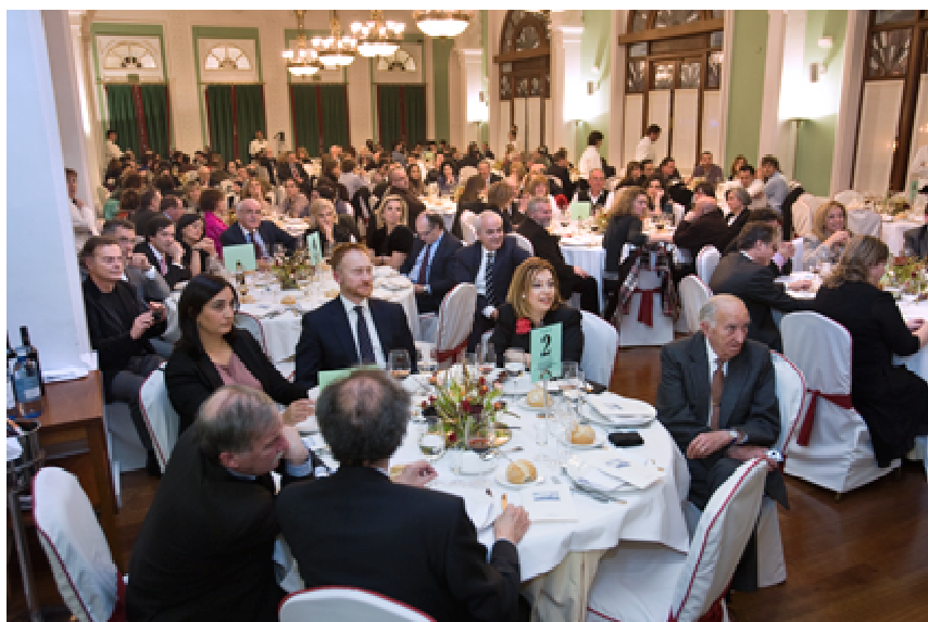
Casi doscientas personas asistieron a la gala anual de la Asociación de la Prensa