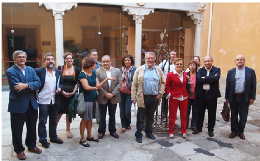
Junta directiva de la FAPE reunida en Segovia