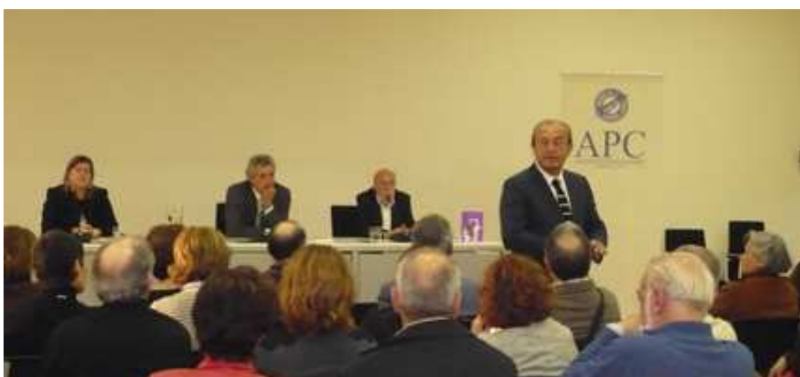
El consejero de Cultura se dirige al público asistente al acto