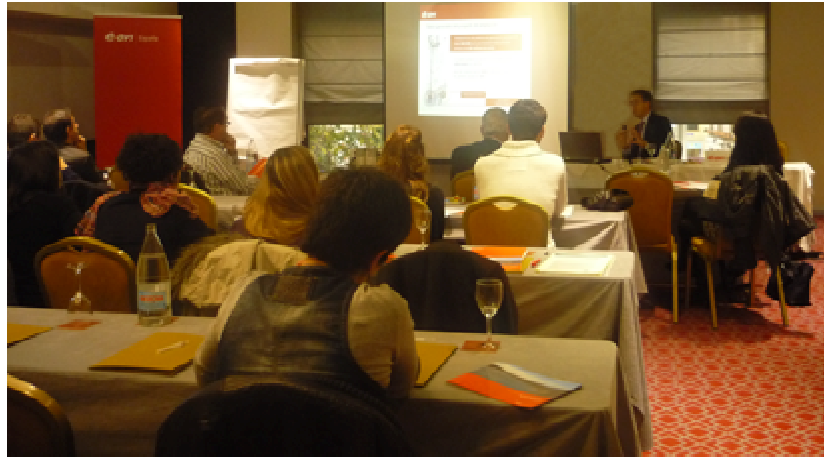
Un momento de la jornada 'Sector eléctrico y medios de comunicación'