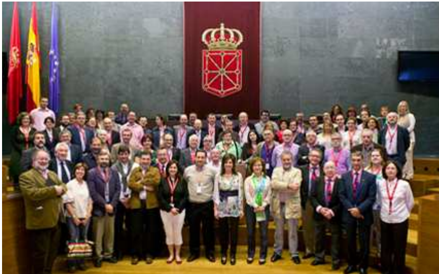
Miembros de la FAPE en la LXX Asamblea General celebrada en Pamplona