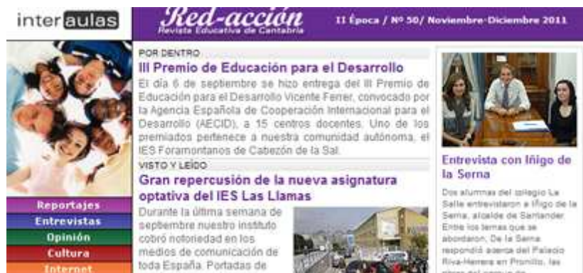
Número 50 de la revista digital 'Red-Acción' del Proyecto InterAulas

La Asociación de la Prensa de Cantabria y la Consejería de Educación patrocinan este programa en el que participan 76 centros educativos de la región